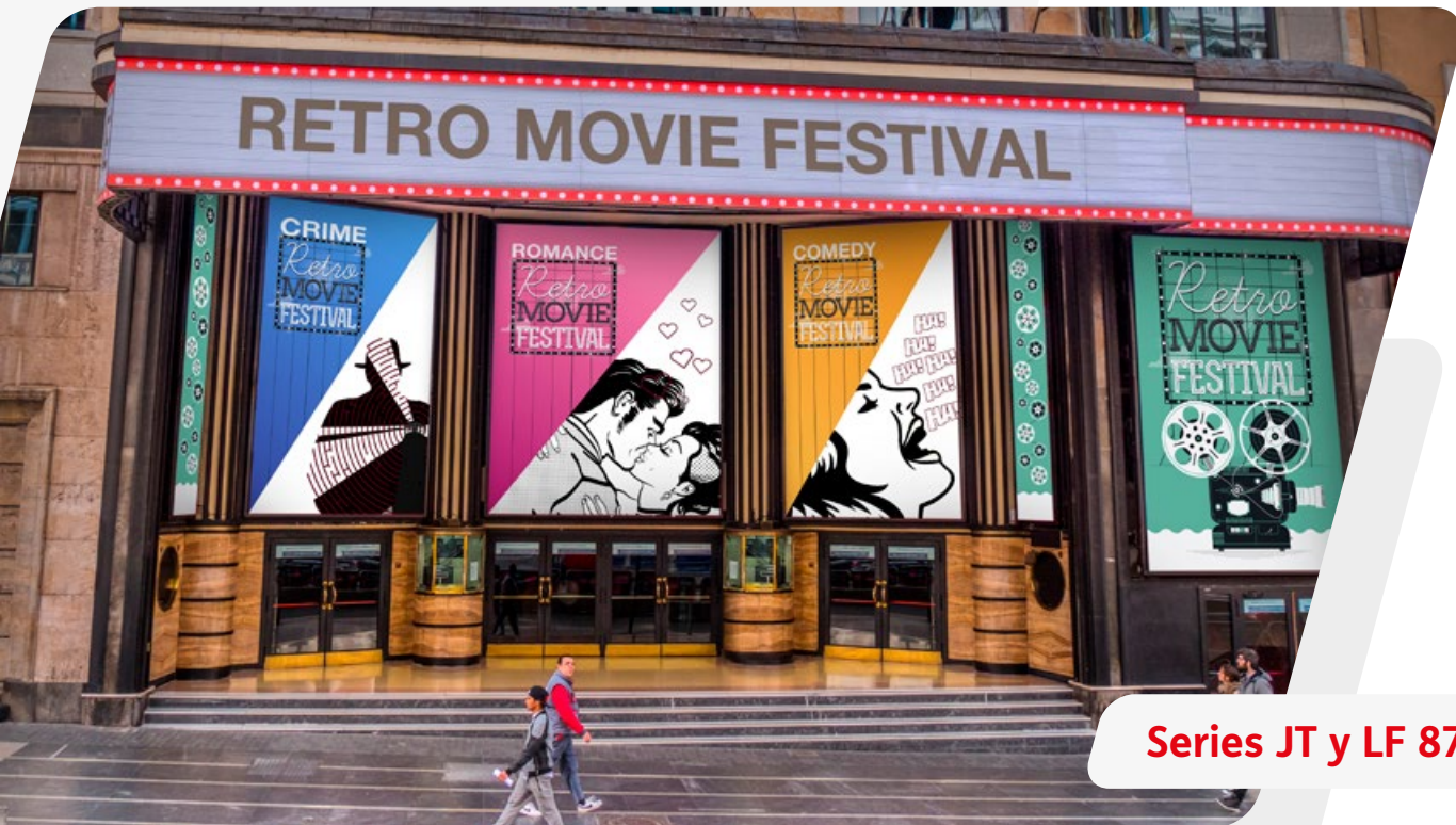
Series JT y LF 8700

Para superficies planas que no necesitan de relieve