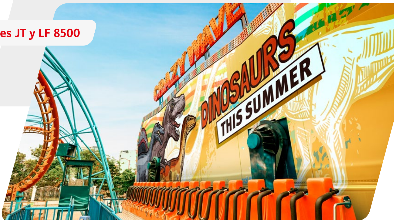
Series JT y LF 8500