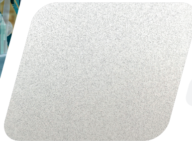
JT 9700 Frosted