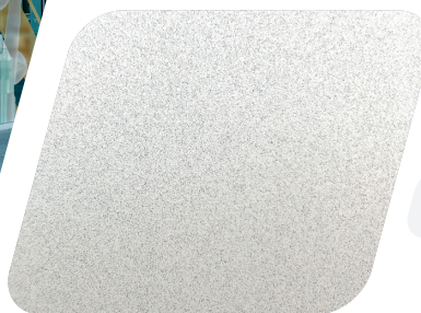
JT 9700 Frosted